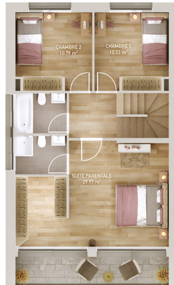
1 er étage